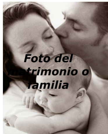
Foto del matrimonio o familia