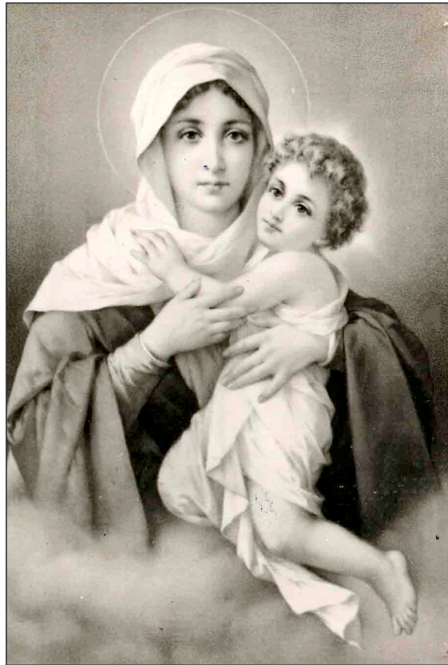
IMAGEN DE MARÍA SEGÚN NUESTRO PADRE Y FUNDADOR

Rama de Familias Movimiento Apostólico de Schoenstatt